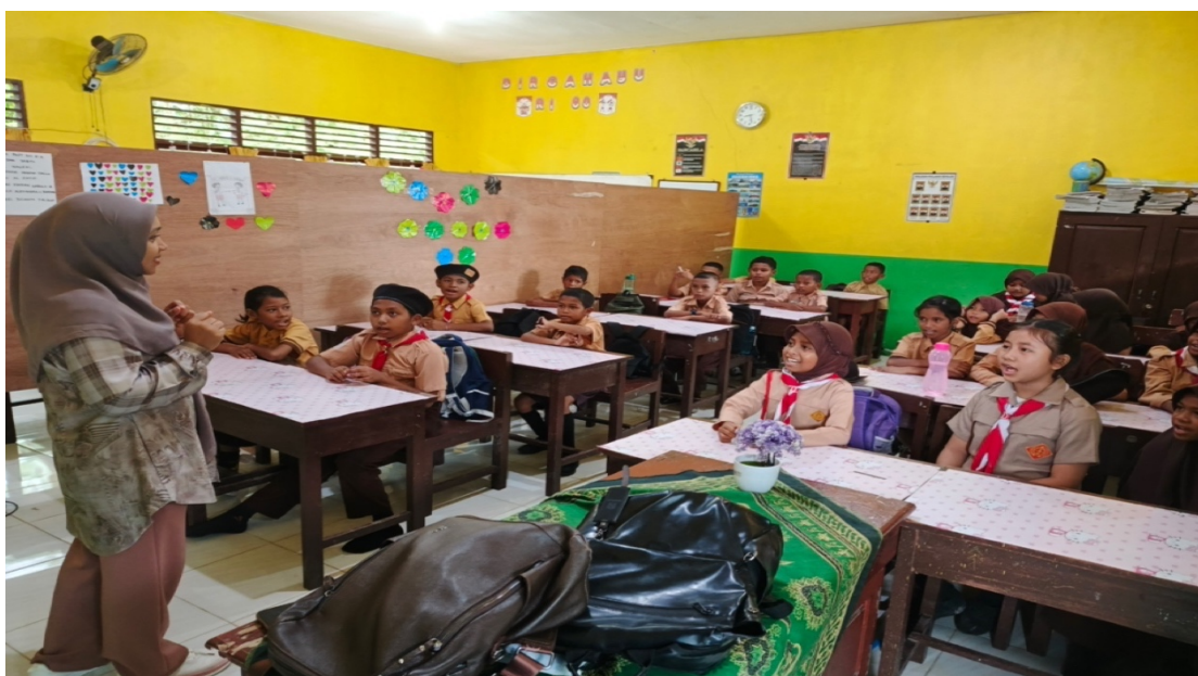
Gambar 1 Suasana Penyampaian Materi

sederhana. Tahap praktik TPR dilakukan dengan memberikan instruksi secara lisan seperti jump , clap , touch your head , dan lainnya, yang diikuti gerakan tubuh siswa secara serentak. Setelah itu, tahap permainan dan evaluasi dilaksanakan untuk mengukur pemahaman siswa melalui lomba perintah cepat, tanya jawab, dan pengulangan kosakata. Berikut beberapa dokumentasi kegiatan: