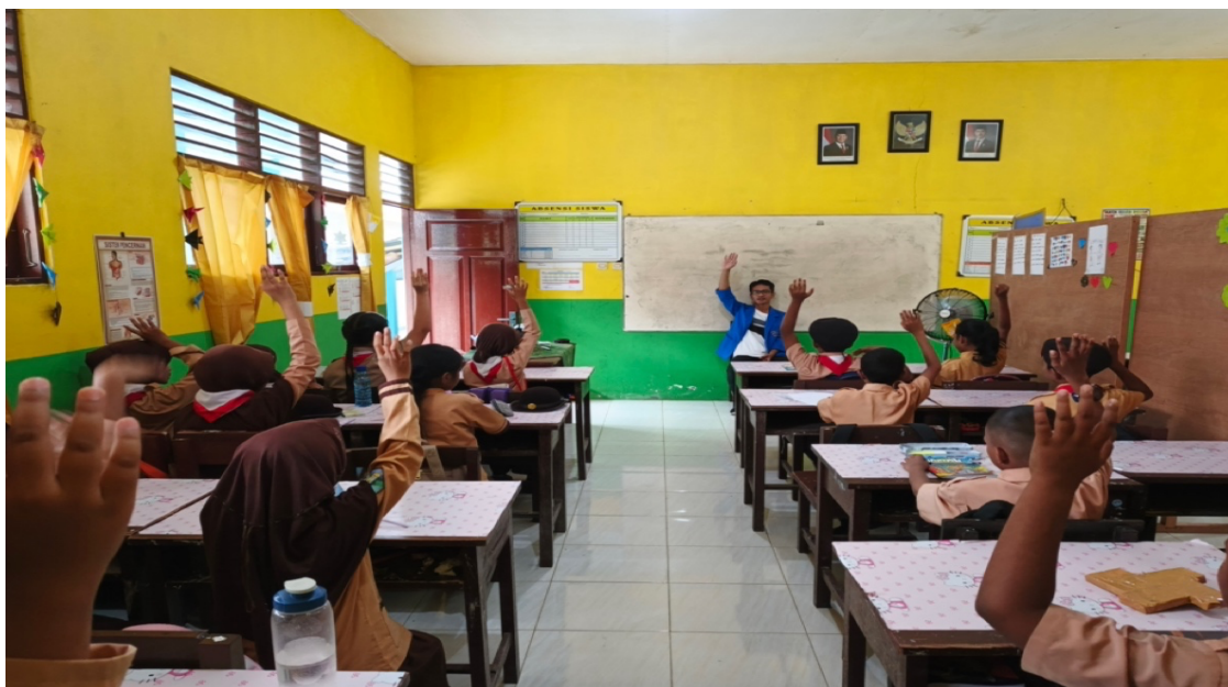
Gambar 2 Suasana pendampingan materi menggunakan metode TPR