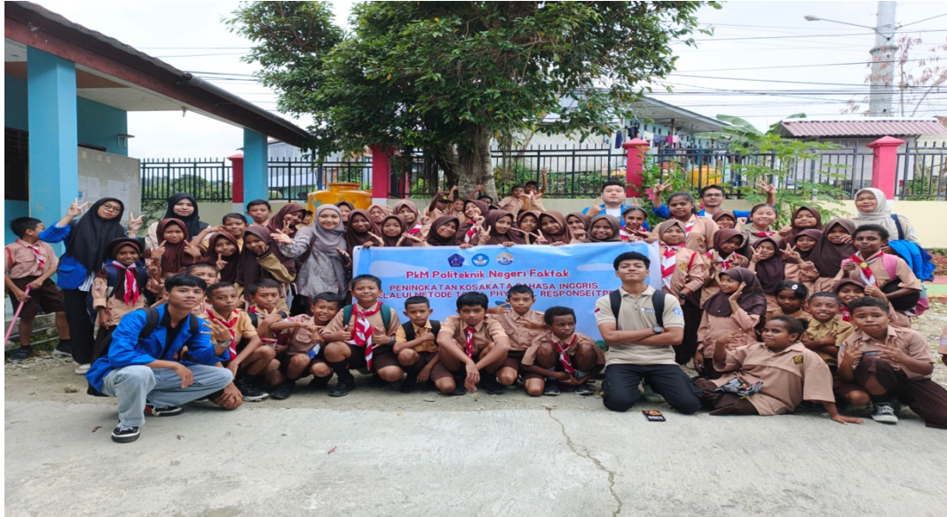
Gambar 3 Foto bersama seluruh peserta

Adapun hasil dari kegiatan ini menunjukkan siswa mampu merespons instruksi dengan cepat, mengingat kosakata baru dengan baik, serta menunjukkan peningkatan kepercayaan diri dalam berbicara bahasa Inggris. Pendekatan berbasis tahapan ini terbukti efektif menciptakan suasana belajar yang aktif, menyenangkan, dan mudah dipahami, sekaligus memberikan pengalaman mengajar yang berharga bagi mahasiswa pendamping. Ini dibuktikan dengan perbandingan hasil penguasaan kosakata sebelum dan sesudah pelatihan. Hasil menunjukkan adanya peningkatan penguasaan kosakata siswa dari kategori sedang ( \pm 50\% ) sebelum pelatihan menjadi tinggi (82%) setelah penerapan metode Total Physical Response (TPR).